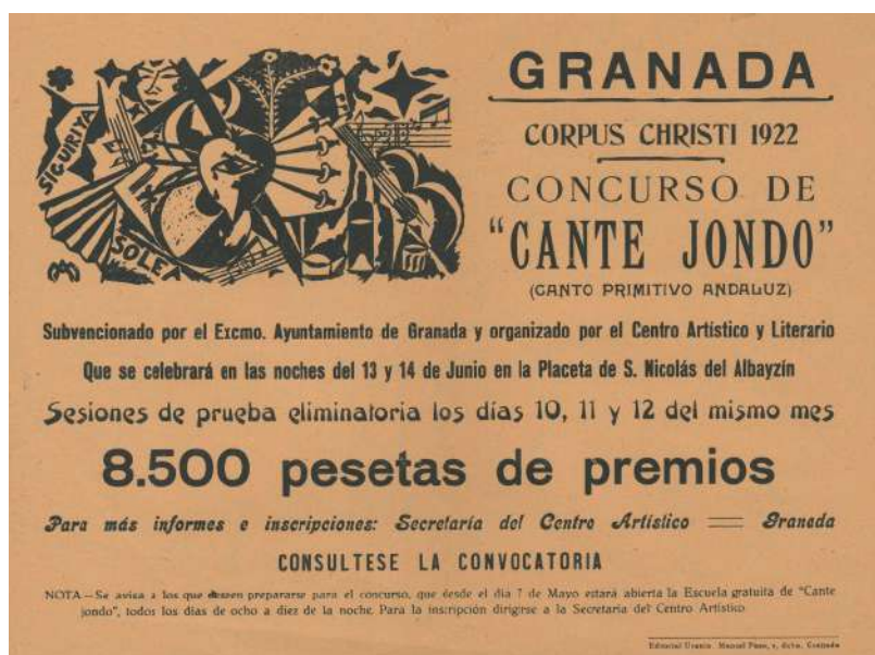
Imagen: Pasquín anunciador del Concurso

El Concurso de Cante Jondo celebrado en Granada los días 13 y 14 de junio de 1922, en la Plaza de los Aljibes de la Alhambra, será recordado, con motivo de su primer centenario, en la 71 edición del Festival Internacional de Música y Danza de Granada, con una programación especial, que comenzó ya en la edición de 2021 y continuará en la de 2023, con la mirada puesta en el origen y entorno de aquella cruzada musical y vanguardista por el flamenco.