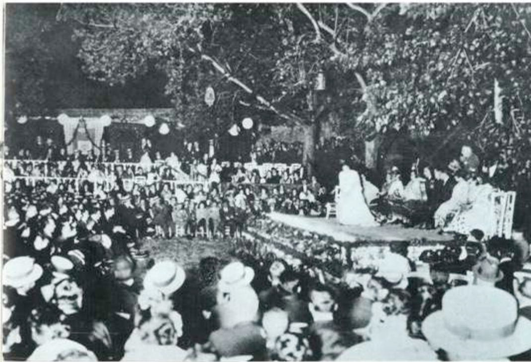
CONCURSO DE CANTE JONDO EN LA PLAZA DE LOS ALJIBES. AÑO 1922.

emergentes que luego encumbraría el cante como Manolo Caracol, quien compartió el primer premio (con solo 13 años). En aquellas jornadas se pudo escuchar a Manuel Torre (seguiriya), Ramón Montoya (rondeña), La Niña de los Peines (saeta), La Gazpacha (zambra), La Macarrona (cantiña), don Antonio Chacón (granaína) y un largo etcétera de artistas.