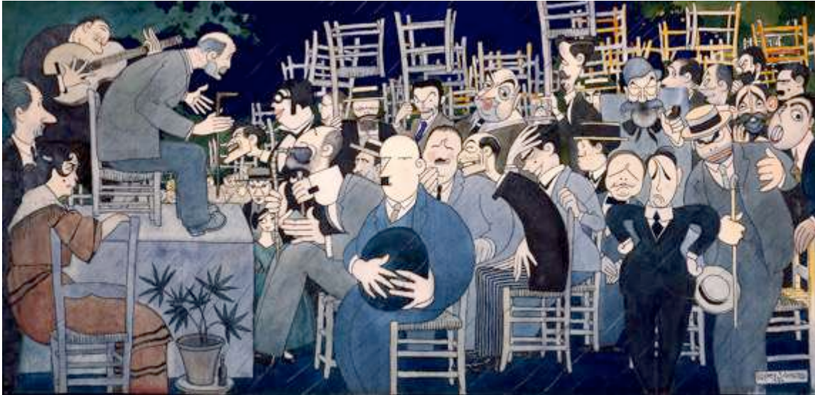
Imagen: Concurso de Cante Jondo, 1922 – Caricatura de López Sancho – Ayuntamiento de Granada

Bajo el epígrafe #granada1922 se presentarán una serie de recitales de flamenco, conciertos sinfónicos y de cámara, y espectáculos de ballet clásico danza flamenca, que rinden homenaje a aquellos artistas que participaron en el Concurso de 1922 y dejaron un inmenso legado artístico. Habrá estrenos y encargos, actuaciones en el Patio de los Aljibes, Auditorio Municipal La Chumbera, Palacio de Carlos V, Teatro del Generalife y Centro García Lorca. Asimismo, se celebrarán conciertos y otras actividades enmarcadas en las programaciones del FEX y Cursos Manuel de Falla. Y todo ello tendrá lugar entre los días 13 de junio y 10 de julio de 2022 .